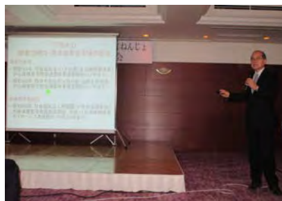
金原理事長の講演