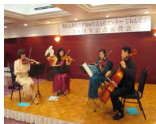
食事中の室内楽の演奏