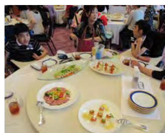
美味しい食事を囲んで